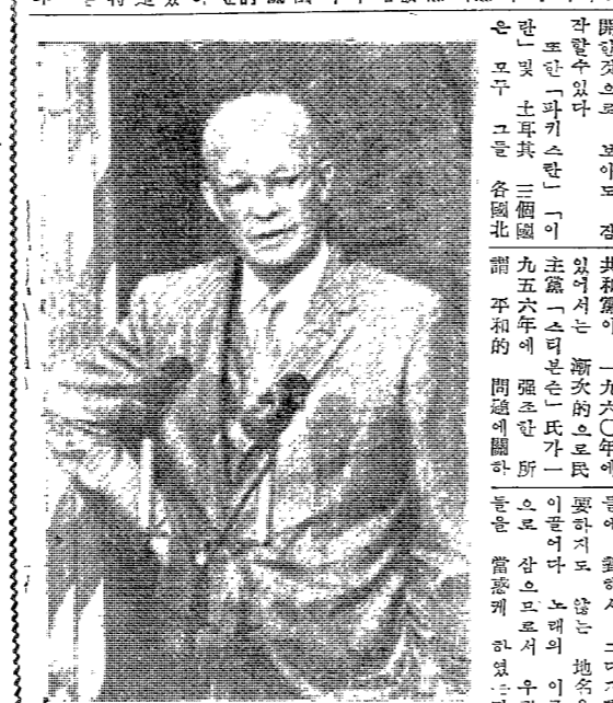
「大總統」之交換訪問外交

「大總統」之交換訪問外交，已成為國際政局中之新動向。其特點在於：(一) 交換訪問之頻繁化；(二) 交換訪問之實質化；(三) 交換訪問之國際化。此種交換訪問外交，已成為國際政局中之新動向。其特點在於：(一) 交換訪問之頻繁化；(二) 交換訪問之實質化；(三) 交換訪問之國際化。