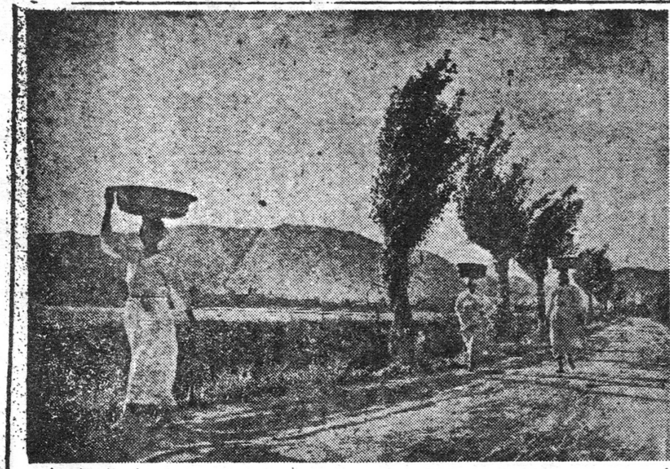
佛敎文學의 素材를 찾아서 李東林