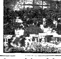
佛敎大講演會開幕式