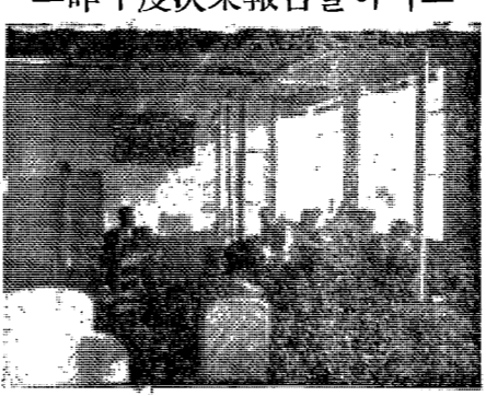
本大學 出版委員會 定期開議 教授圖書出版을討論 二昨年度決果報告를하다