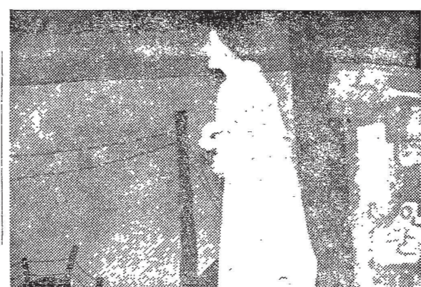
이 시기에 등장한 대표적인 저널리스트들

美國의 저널리즘은 19세기 말부터 20세기 초까지의 시기에 형성된 것으로, 그 초기에는 단순한 사실 보도에 그쳤지만, 점차 사회 비판과 여론 형성의 기능을 담당하게 되었다. 이 시기에 등장한 저널리스트들은 '공공의 이익'을 최우선으로 삼고, '객관성'과 '정직성'을 기치로 삼았다. 그러나 20세기 중반 이후에는 상업적 이익과 정치적 편향에 휩쓸려, 저널리즘의 본래 기능을 상실해가고 있다는 비판이 제기되고 있다. 이 시기에 등장한 대표적인 저널리스트로는 헨리 워싱턴 로저스, 제임스 브라운, 헨리 로스웰 홀츠워스 등이 있다. 이들은 '국민의 친구'라는 구호를 외치며, 대중에게 알맞은 언어와 형식으로 정보를 전달하려 노력했다. 또한, '보도권'을 주장하며, 언론의 자유와 책임을 강조하였다.