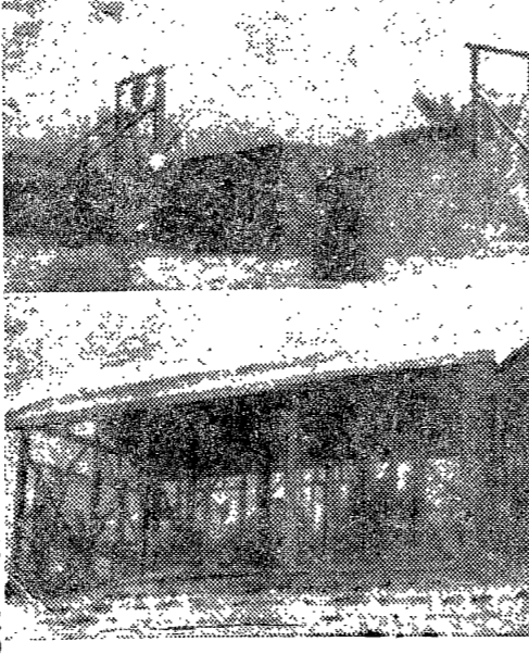
第一農場の講義室新築工事の進行状況

本校附屬建物等工事は、活潑に進行中である。第一農場の講義室新築工事は、今月末頃には竣工確定である。この講義室は、農場の業務に必要であり、また、農学部の学生に有益である。新築工事は、堅固で、設備も整っており、今後の農場の発展に大いに貢献するであろう。