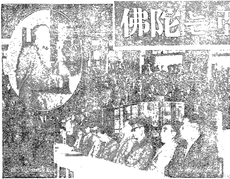
(左起) 西學部學生會會長 演說 西學部學生會 演說 西學部學生會 演說

第四十三回 東國祭典也盛況 十二月二十六日(星期四)聖誕紀念行事。西學部學生會主辦。在東大校園內。上午十時。第一禮堂。由西學部學生會會長。致開會詞。由西學部學生會。演說聖誕紀念之意義。及本校學生之生活。由西學部學生會。演說聖誕紀念之意義。及本校學生之生活。由西學部學生會。演說聖誕紀念之意義。及本校學生之生活。