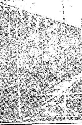
去23日行政學研究會

○本校軍事訓練制度，業已養成方針。該制度之養成，係由本校本部籌劃，並由社會各界捐助，始能完成。現已正式養成方針，定於今月中旬頃歸國。屆時，本校之教學，將更趨於活潑。此項養成方針，係由本校本部籌劃，並由社會各界捐助，始能完成。現已正式養成方針，定於今月中旬頃歸國。屆時，本校之教學，將更趨於活潑。